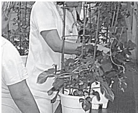
写真3 つる巻き作業の様子