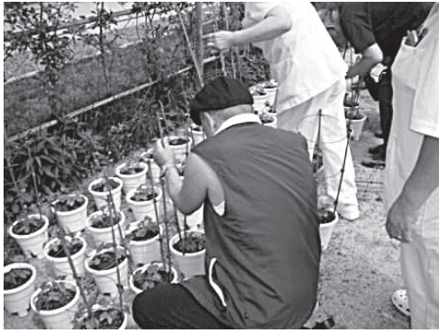
写真2 鉢植えの様子