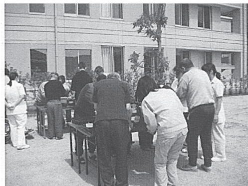
写真1 種まきの様子

種まき作業後，今後の管理方法・予定についてA施設研究者より説明した。その際，対象者