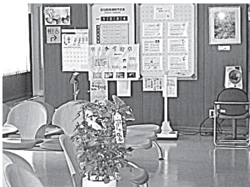
写真4 外来の待合室の様子

きの方向に巻きつけていった。雨降りだったため室内で椅子に座って作業を行った。この園芸作業に17名が参加した。つる巻き作業が繊細で「折れそうで心配だった」と話す対象者がいた。その他、「やって良かった」、「うれしい気持ちになる」、「花が咲くのが楽しみ」等の意見があった。一方、「種植えをしていないから特に気がついたことや感じたことはない」という対象者もいた。(写真3)