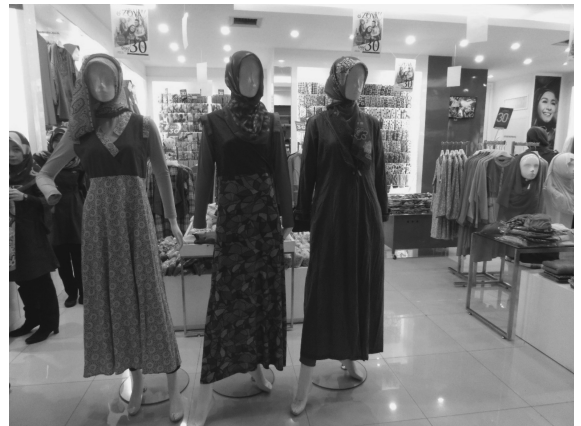
写真1 近年のムスリム服 (2015年8月撮影)

力の強まり、ファッションとしての流行、周囲の人の影響など、様々な背景があって進行している現象である（野中2015、Shioya 2018）。ムスリム服はもとから多様であるが、着用者が増えてファッション性も重視されるなかで、さらに多様性が増した。こうした中で、人々の関心を集めているのは、ファッション性とイスラム的な「正しさ」のバランスである（Shioya 2018）。