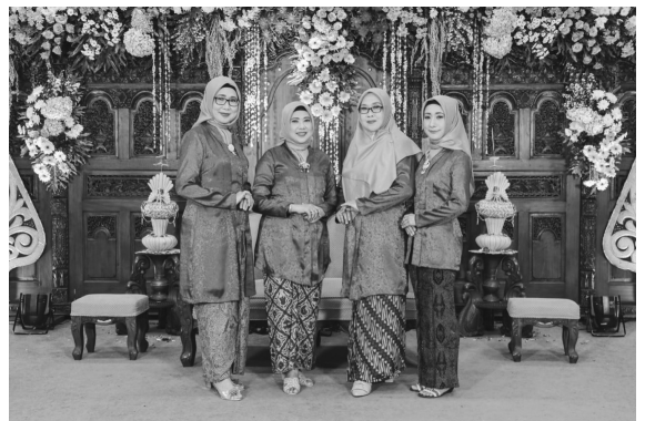
写真3 丈が異なるクバヤ (2019年8月撮影)

「ムスリム用のクバヤ」を着用する、と話した女性もいた。ムスリム用のクバヤは、丈の長さが通常より長いのが特徴だそう。通常のクバヤは、腰下くらいの丈のものが多いが、ムスリム用は膝丈である。ムスリム用のクバヤが登場する前から、クバヤの丈は時代ごとに変化しており、スカート丈のように、長いもの・短いものが、それぞれ流行してきた。着用者の身長にあわせて、似合う丈が選ばれることもある。一方、王宮の文脈では、前述のように丈の長さに階層が反映されている。しかし、近年では長い丈のものが、ムスリム用のクバヤと呼ばれるという変化が起こっているのである。