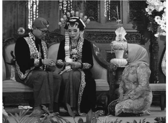
写真2 ジャワの婚礼衣装 (2019年8月撮影)

の祖母にバティックについて話を聞くことができた。彼女は、自分が着用しているバティックは、結婚式の日に花嫁の祖母が身に着けると決まっている模様で、この日のために準備したと話してくれた。