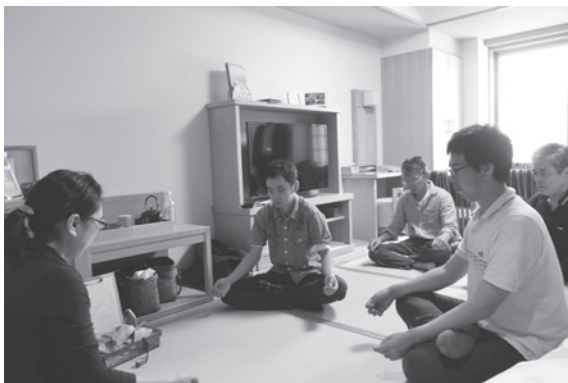
図4 実証実験の様子。上から順に稲佐の浜でのヨガ、出雲大社早朝参拝、瞑想の様子。