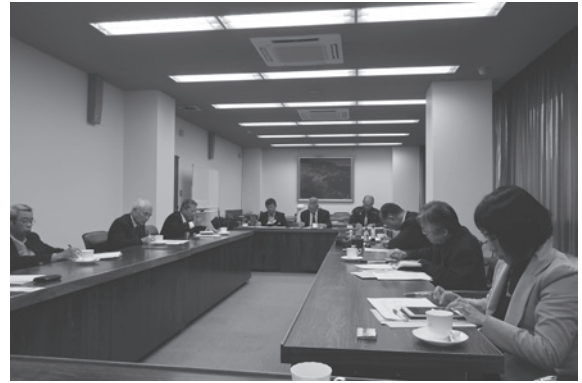
図5 出雲商工会観光部会との意見交換会