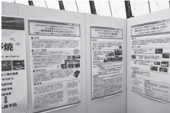
図1 「いずも産業未来博 2017」出展の様子