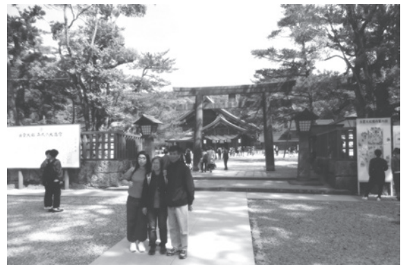
図6 出雲大社の外国人観光客

4%減少したが、外国人宿泊者数は6144人と27%も増加している。実際に図6に示すようなアジア系の外国人観光客を見る機会も多くなった。