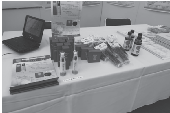
図2 「いずも産業未来博 2017」出展の企業と本学との共同開発品